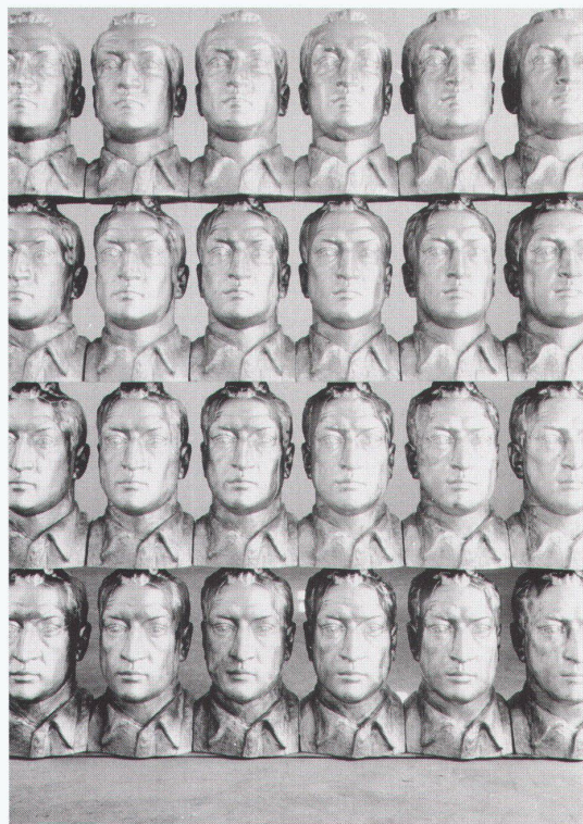
Wien, MAK – Österreichisches Museum für angewandte Kunst: Hans Kupelwieser, Trans-Formation

Lausanne, Musée des arts décoratifs Sièges en vedette 1972 à 1993 avec la collaboration du Musée Vitra bis 2.1.1995