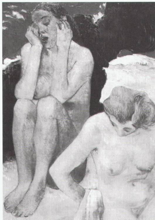
Paris, Musée d'Orsay: Paul Gauguin, La Vie et la Mort, 1889

München, Kunsthalle der Hypo-Kultur-Stiftung Edvard Munch und Deutsch- land bis 27.11.