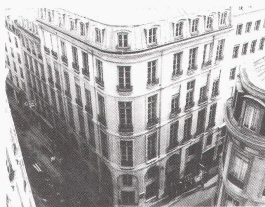
Architektur für den Film ist kein Film über Architektur (Szene aus «Metropolis», Deutschland 1926; Regie: Fritz Lang)