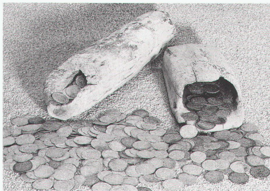
Chur, Rätisches Museum: Münzfund von Stampa/Maloja, 1333–1390, Prägungen von Genua, Venedig, Mailand, Pavia, dem Erzbistum Trier und dem Kurfürstentum Pfalz

Frankfurt, Schirn-Kunsthalle Asger Jorn: Retrospektive bis 12.2.