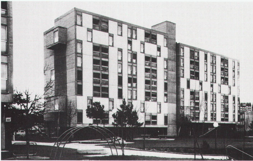
Fribourg, Centre d'art contemporain: Wohnhaus Sicoop Schönberg in Fribourg, 1965–1967

Wolfsburg, Kunstmuseum Gilbert & George bis 12.3. Bart van der Leek bis 26.2.