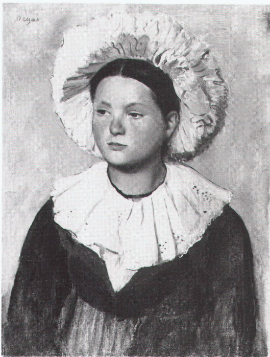
Zürich, Kunsthaus: Edgar Degas, La Savoisienne, ca. 1873

Dortmund, Deutsches Kochbuchmuseum Die 50er Jahre: Irgendwann sind alle Frauen Hausfrauen bis auf weiteres