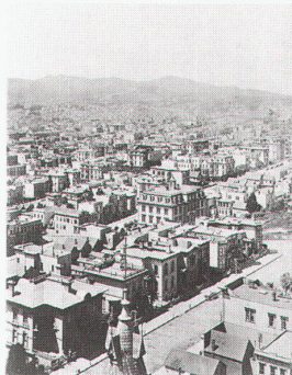
Zürich, ETH-Zentrum, Eadweard Muybridge: Panorama of San Francisco, 1878, zwei von 13 Tafeln

Berlin, Altes Museum am Lustgarten Architekturmodelle der Renaissance: Die Harmonie des Bauens von Alberti bis Michelangelo bis 7.1.1996