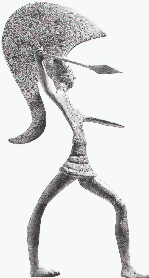
Zug, Museum in der Burg: Krieger (etruskisch, Italien), 5. Jahrhundert vor Christus

Baden, Historisches Museum Vom Spontispruch zur Spraycan-Art: Wandsprüche und Graffiti im Raum Baden bis 31.12.