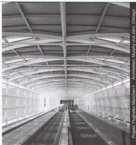
Projekt: Flughafen München II Architekten: Murphy und Jahn, Chicago

Stahl-Glas-Konstruktionen in architektonisch perfekter Vollendung verwirklichen wir mit innovativen Ideen und höchsten Anforderungen an Materialien und Ausführung.