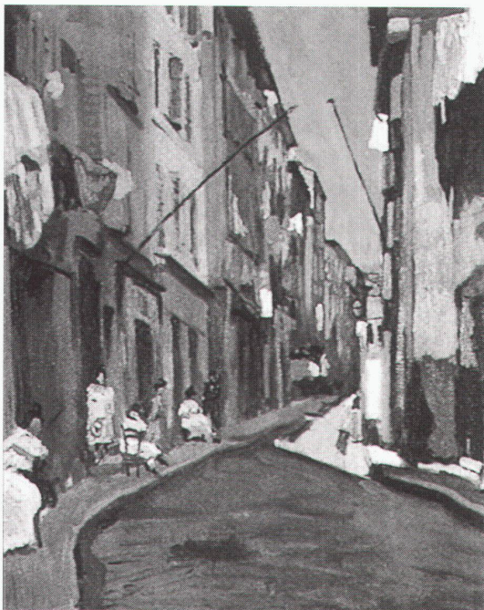
Lausanne, Fondation de l'Hermitage: Charles Camoin, La rue Bouterie, 1904

Ennenda, Museum für Ingenieurbaukunst Christian Menn, Brückenbauer bis 27.9.