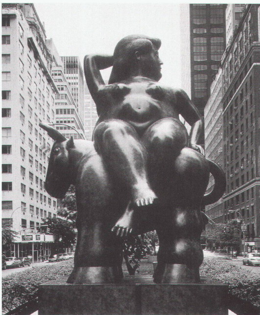
Lugano, Museo d'Arte Moderna: Fernando Botero, Ratto d'Europa, 1992