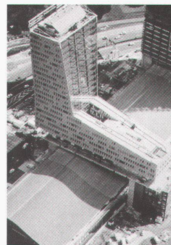
Wien, Architekturzentrum: Euralille: Creating a New City, Christian de Portzamparc. La tour du Crédit Lyonnais

Bordeaux, arc en rêve centre d'architecture 36 modèles de maisons bis 18.1.1998