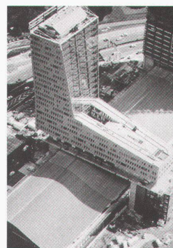
Wien, Architekturzentrum: Euralille: Creating a New City, Christian de Portzamparc. La tour du Crédit Lyonnais

Bordeaux, arc en rêve centre d'architecture 36 modèles de maisons bis 18.1.1998