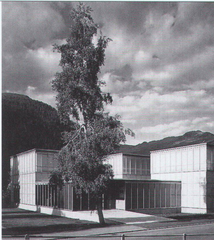
Projekt: Ernst Ludwig Kirchler Museum Architektin: Gigon & Guyer, Zürich

Ästhetik, Wirtschaftlichkeit und bauphysikalische Anforderungen in Einklang zu bringen, ist das Ergebnis ausgereifter Konstruktionen. Qualitätsbewusstsein und partnerschaftliche Zusammenarbeit sind nur einige der Voraussetzungen für ein gutes Gelingen in dieser vielfältigen Branche.