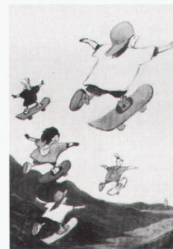
Basel, Karikatur & Cartoon Museum: Kids & Co.!

Hamburg, Museum für Kunst und Gewerbe Käfer: Der Erfolgswagen. Nutzen – Alltag – Mythos bis 30.11.