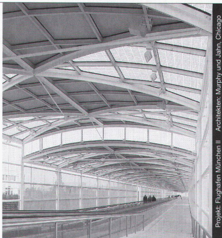
Projekt: Flughafen München II - Architekten: Murphy und Jahn, Chicago

Stahl-Glas-Konstruktionen in architektonisch perfekter Vollendung verwirklichen wir mit innovativen Ideen und höchsten Anforderungen an Materialien und Ausführung.