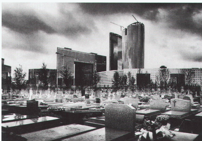
Paris Nanterre 1995

Zum drittenmal vergibt die «deutsche bauzeitung» einen Preis für Europäische Architekturphotografie. Nach den Themen «Mensch und Architektur» vor drei Jahren und «Architektur schwarzweiss» 1997 steht ein weiterer wichtiger Aspekt der Architekturphotografie im Mittelpunkt: die Frage nach dem Ort, der Umgebung eines Gebäudes. Gezeigt werden soll, ob und wie die Umgebung ein Gebäude geprägt hat. Wurde auf