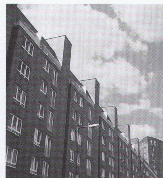
Josef Paul Kleihues: Wohnüberbauung Brunnenstrasse, Berlin

genannt wurde. Trotz eines weltweiten Aktionsradius – was seine Bauten, aber auch seine Bewunderer angeht – darf Berlin nach wie vor als Mittelpunkt seines Wirkens gelten: Das zeigen nicht nur «Kontorhaus Mitte» und «Triangel-Haus» an der Friedrichstrasse, sondern auch der Umbau des Hamburger Bahnhofs. Den Boden für solche Projekte hat er selbst bereitet: Zwar nicht allein, aber doch in verantwortlicher Position organisierte er seit 1979 die Internationale Bauausstellung (IBA) und verhalf ihr zu einer Aufsehen erregenden Umsetzung. Und das seinerzeitige Programm ist, wie das «Planwerk Innenstadt» signalisiert, immer noch en vogue. Denn damals wie heute sollte die Aufnahme und Neuinterpretation überlieferter Stadtstrukturen vornehmlich zur Rückgewinnung der Stadt als Wohn- und Lebensraum dienen. Ein hehrer Anspruch!