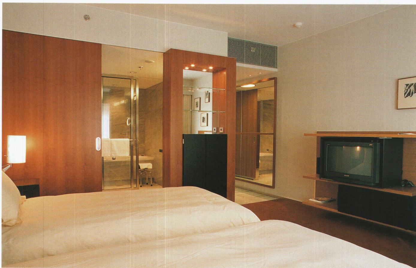
Grosszügige Raumwirkung im Standardzimmer ▶ Générosité spatiale dans la chambre standard