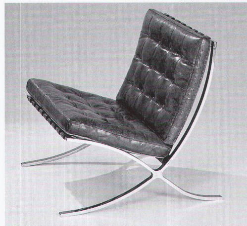
Der Barcelona-Sessel von Mies van der Rohe

Die Ausstellung im Vitra Design Museum in Weil am Rhein dauert noch bis 25. April, gastiert dann in Glasgow und Delmenhorst, ehe sie im Dezember 1999 und im Mai 2000 an die Originalschauplätze – Brno und Barcelona – zieht. Der Katalog, u. a. mit einem Beitrag über die Möbelentwürfe von Otokar Mäcel, Essays zu den drei Bauten von Karin Schulte, Wolf Tegethoff und Lenka Koudelkova und einem persönlichen Nachwort von Werner Blasler, in Deutsch oder Englisch, kostet 58 DM.