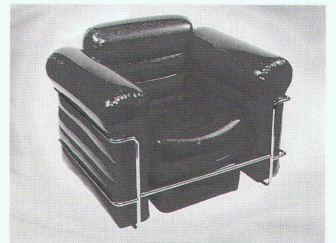
Sofina: «Steel Frame Chair»