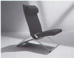
Interprofil: «X-Chair», Design Joachin Ness

schweizer möbelmesse international 22. bis 26. April 1999 Messebericht