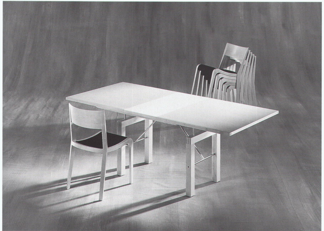
Girsberger: Tisch «Travolo» und Stuhl «Triangolo»

und dynamische Form und stufenlos verstellbar bis zur Liege, indem das Rückenelement leicht angehoben und nach hinten gezogen wird.