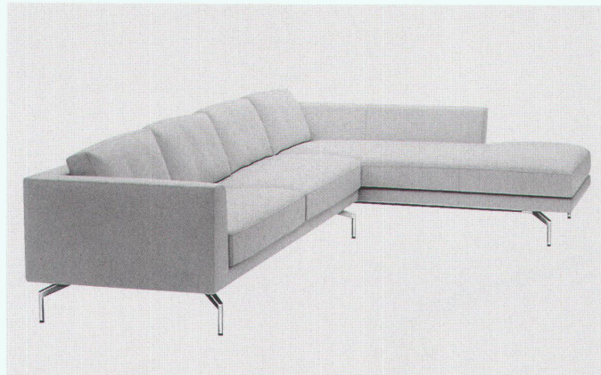
«Room Chillout»: Sofa «small», Design Hannes Wettstein