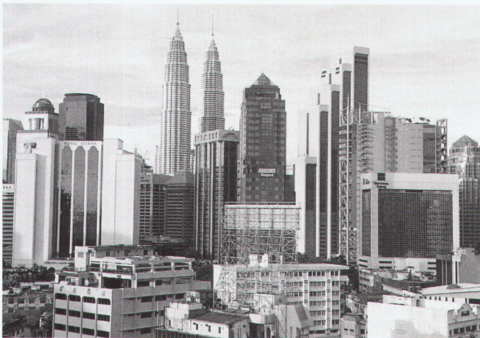
Die Skyline Kuala Lumpurs mit den Petronas Twin Towers von Cesar Pelli

Die bewegte, hügelige Topografie und die tropische Vegetation, die selbst die winzigsten Grünflecken zu blühenden Oasen macht, verhelfen der Stadt zu einem gewissen unübersichtlichen Charme. An ihren Rändern jedoch zeigt sie sich in einem ganz anderen Licht. Jeder, der nach KL reist, sieht vom Flugzeug aus die Furchen aus angebaute Beton, die die häufigste Wohnform in Malaysia sind. Angelegt mit der sturen Regelmässigkeit von Plantagen, die zuvor das Land bedeckten, erstrecken sich Reihenhäuser glanzlos bis zum Horizont. Reihe auf Reihe die gleichen Einheiten, unterschieden allenfalls durch verschiedene davor geklebte Fassaden oder Nuancen des – immer – pastellfarbenen Fassadenanstrichs. Wenngleich die Moden sich ändern und nun eher das so genannte Condominium als burgartige Grosswohnanlage das Bild bestimmt: Bedenkenlos wird hier für eine Nachfrage geklotzt, die nicht zuletzt darauf beruht, dass die Prosperität verheissende Kapitale ländliche Zuwanderer anzieht wie ein Staubsauger.