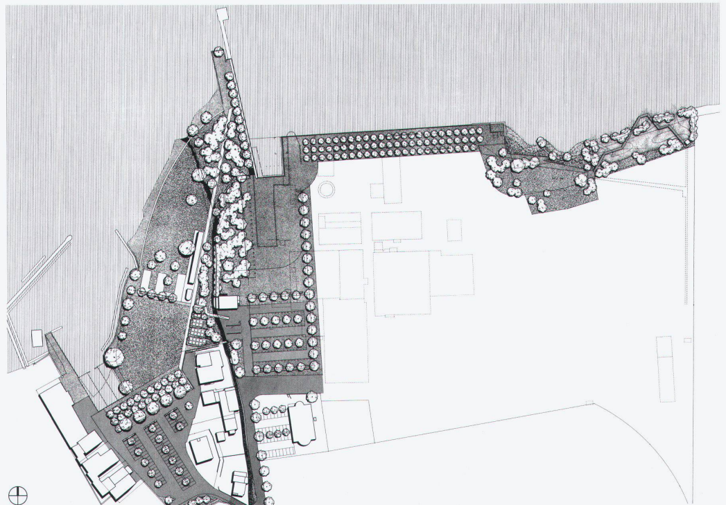
Situationsplan des Gesamtprojektes

Dank einer fortschrittlichen Gemeindepolitik wird das «natürliche» Seeufer mit erheblichem Aufwand öffentlich gemacht. Die verschiedenen neuen Funktionen wie Festplatz, Baden, Landesteg, Promenade, Parking, Biotop werden geschickt in eine rationale Gestalt überführt. Die Einheitlichkeit von Sprache und Mitteln bewirkt eine grosse Bestimmtheit bei gleichzeitiger klarer Abgrenzung gegen die Natur. Wird auf dem angrenzenden Areal Steinfabrik die projektierte Überbauung realisiert und das Ende des Spazierweges mit dem Ort verbunden, so wird die Uferanlage, wie vorgesehen, ein Teil des Dorfes sein. B.J./I.N.