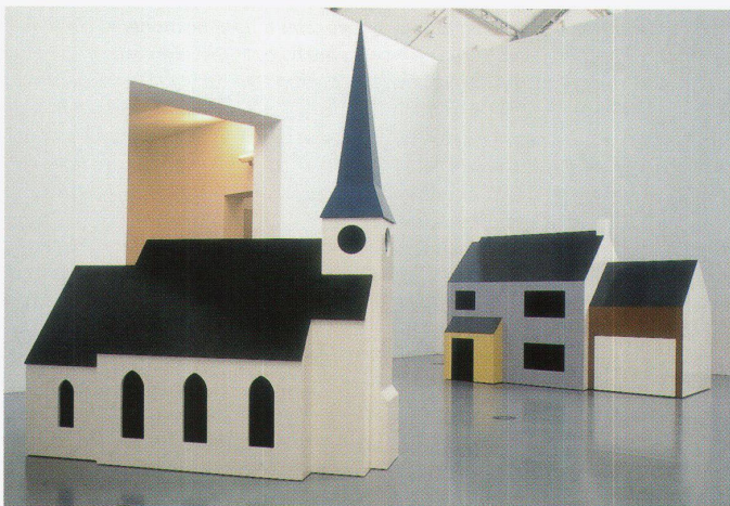
«You see a Church» und «You pass a House», Julian Opie, Ausstellung: HausSchau – Das Haus in der Kunst, Deichtorhallen Hamburg