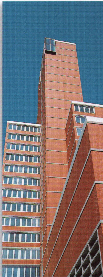
Objekt: Swisscom-Hochhaus, Winterthur, Architekten: Urs Burkard, Adrian Meyer und Partner, Architekten BSA SIA, Baden, Stein: kelesto®-KLINKER, rot, 24/11,5/5,2