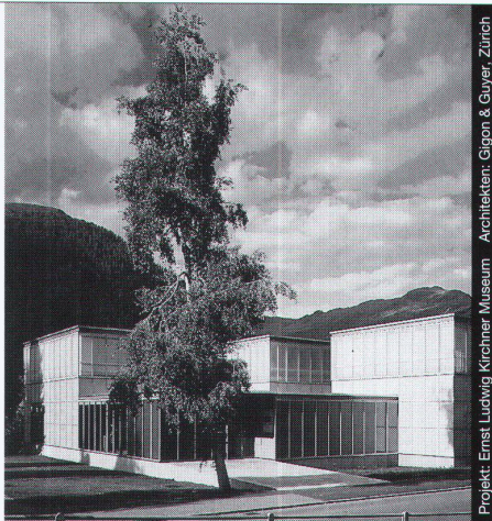
Projekt: Ernst Ludwig Kirchner Museum Architekten: Gison & Guyer, Zürich

Ästhetik, Wirtschaftlichkeit und bauphysikalische Anforderungen in Einklang zu bringen, ist das Ergebnis ausgereifter Konstruktionen. Qualitätsbewusstsein und partnerschaftliche Zusammenarbeit sind nur einige der Voraussetzungen für ein gutes Gelingen in dieser vielfältigen Branche.