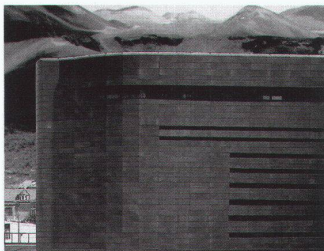
4 | Fire Mountains (Umspannwerk Innsbruck)