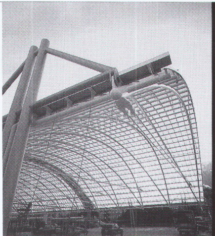
Projekt: Postautostation Chur Hallendach - Architekten: Brosi Chur & Obrist-St.Mentz

Stahl-Glas-Konstruktionen in architektonisch perfekter Vollendung verwirklichen wir mit innovativen Ideen und höchsten Anforderungen an Materialien und Ausführung.