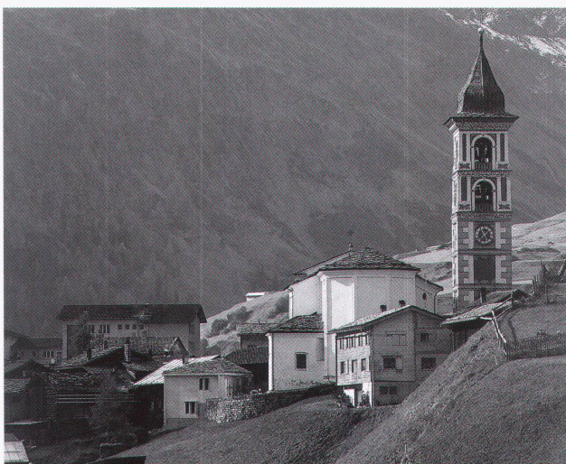
Gion A. Caminada. Stiva da morts, Vrin, 2002.

Sein wichtigster Bau ist die expressive Villa Girardet in Hennef, auch Feuerschloss genannt (1904–06). Tettau gewinnt vor dem finnischen Architekten Eliel Saarinen den öffentlichen Wettbewerb für das «herrschaftliche Wohnhaus» des Essener Verlegers Wilhelm Girardet. Die Komplexität und die künstlerische Ausformulie-