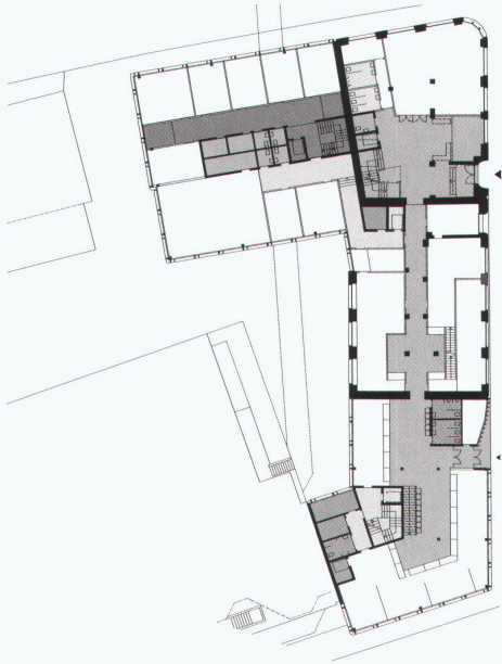
2. Rang / 2. Preis: Keller Schulthess Architekten, Amriswil Erdgeschoss und Ansicht von Norden