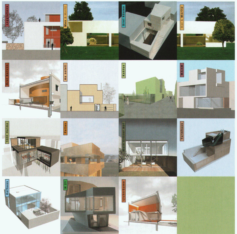
Siedlung Stegbünt: 15 Hausentwürfe von 14 jungen Architekturbüros

Dabei ist zunächst mal viel Erfreuliches am Vorhaben auszumachen. Die Projektentwickler, Belvedere Architekten (Bremgarten BE), regte die Konzeption einer Siedlung an, in deren Rahmen junge, profilierte Architektinnen und Architekten ihre Vorstellungen vom «Wohnen im 21. Jahrhundert» verwirklichen sollten. Tatsächlich finden sich unter den Beteiligten zahlreiche, welche längst mit prononcierten Wettbewerbsbeiträgen auf sich aufmerksam gemacht haben, aber noch kaum oder wenig haben umsetzen können. Die wenigen vergleichbaren Siedlungsprojekte setzen auf die Anziehungskraft etablierter Namen, so in der Beton-Musterhaus-Siedlung am Wiener Stadtrand (unter Leitung von Adolf Krischanitz, s.werk, bauen wohnen 1/2-03, S.68f), oder in der Planung gebliebenen Siedlung Melchrüti in Zürich-Wallisellen (geplant 1996–97, schliesslich aus einer Hand entworfen und gebaut). Und es ist zunächst einmal ver-