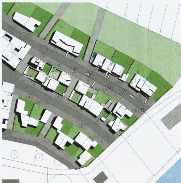
Siedlung Stegbünt: Lageplan

tekten auf der Grundlage des höchst rigiden Masterplans von West8 mitgeknüpft haben.