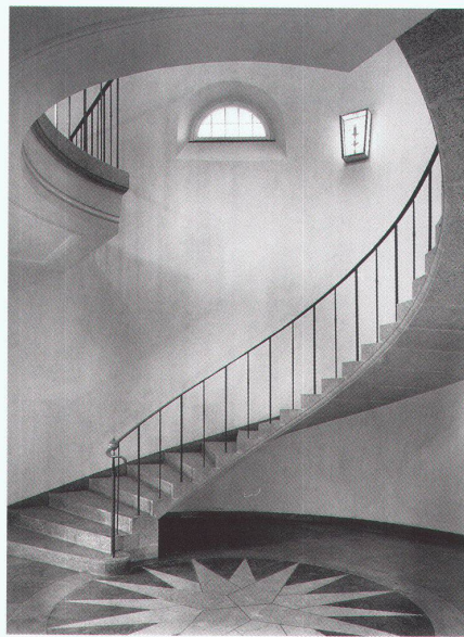
Dresdner Bank «Königin-Olga-Bau», Stuttgart, 1949–55. Treppenhaus.

Schmitthenner wurde nicht zum Naziopfer, denn er konnte seinen Stuttgarter Lehrstuhl be-