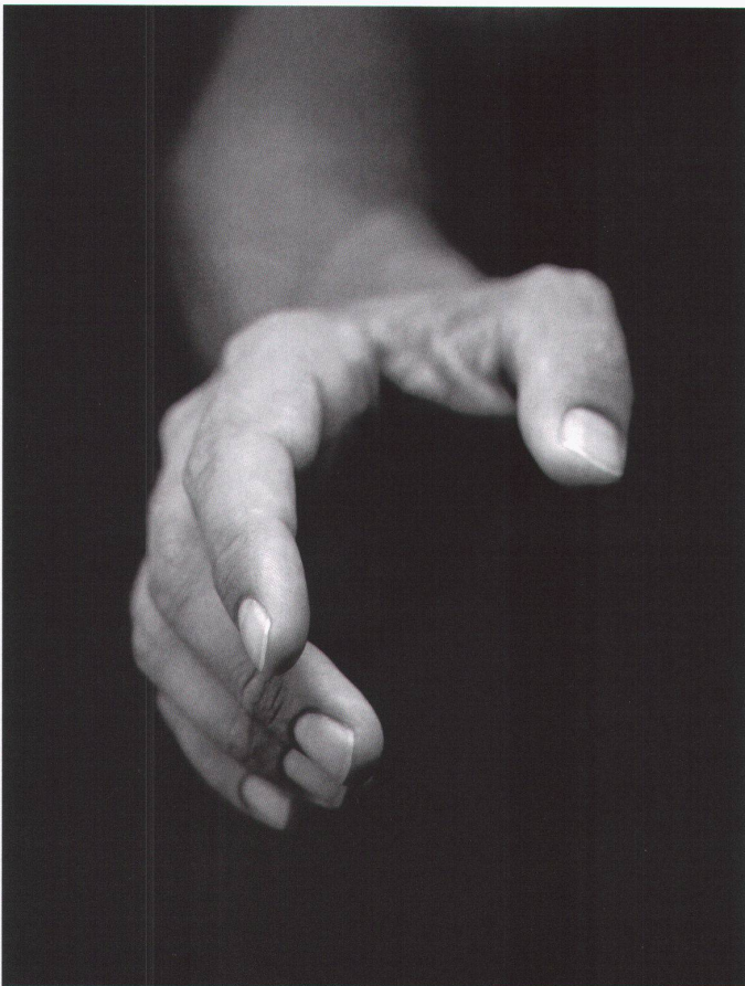
FSB Vertretung: Link Objektberatung, Gasterweg 1, 8730 Uznach, Telefon 055 2804760, link.schweiz@fsb.de, www.fsb.de