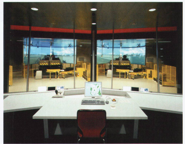
Luscher Architectes: Gebäude für Panzerhaubitzen-Schiesssimulatoren, Bière

üben hier auch Manipulationen am Äusseren der «Panzer», etwa das Starten des Generators, das Beladen mit Munition u.ä. Die Simulatoren gleichen daher amputierten Panzern, wobei die Umgebung über hochpräzise Digitalprojektoren als Panorama auf einen Rundschirm projiziert wird, der vor dem Gerät hängt wie die Karotte vor der Nase des Esels.