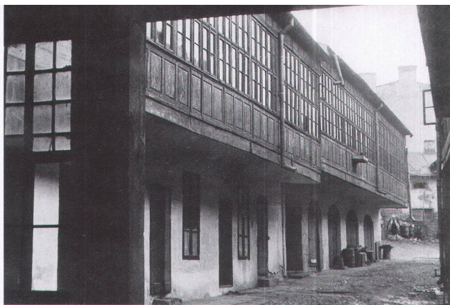
4 Haus in Bukarest, gebaut Anfang des 17. Jahrhunderts, umgebaut um 1855

derselben – die Fassade löst sich als Ganzes in mehrere Ebenen auf. Bedingt durch die räumliche Staffelung der verschiedenen Materialschichten entsteht eine klimatische Pufferzone. Die vorgelagerte Glashülle fängt im Winter das in flachem Winkel einstrahlende Sonnenlicht ein, sodass sich die dahinter liegende Luft erwärmt. Die Brüstungen, wenn nicht verglast, sind aus dunklen Holzbrettern oder dünnen Blechtafeln, welche die Sonnenwärme sofort nach innen leiten. Im Sommer, wenn die Sonne steil am Himmel steht, bildet das vorspringende Dach einen Schutz vor übermässiger Erwärmung. Die vordere Verglasung wird dann ganz oder teilweise entfernt, oder die oberen Fensterflügel sorgen für eine ausreichende Belüftung. Weisse Tücher oder weisse Papiere, an der Innenseite der Glasscheiben angebracht, weisen die Sonnenstrahlen ab und verschatten Teile der Hauswand (Abb. 3). So vermag sich die verglaste Zwischenschicht ener-