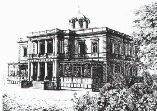
Villa Planta, Chur, um 1882.

Im Vorwort zum 1999 erschienenen Führer zur Gegenwartsarchitektur «Bauen in Graubünden» hält Leza Dosch fest, dass einer der Gründe für die vielbeachtete Bündner Architekturszene im Architekturwettbewerb liegt. 1 Mit der konsequenten Anwendung dieses Instruments soll eine Politik fortgesetzt werden, die im Kanton Graubünden Tradition hat. Denn der Architekturwettbewerb ist ein objektives Verfahren, mit dem die öffentliche Hand dem Kulturauftrag nachkommt, gestalterisch und konstruktiv Dauerhaftes zu errichten. Dies galt auch schon 1981, als die Regierung des Kantons Graubünden einen Wettbewerb veranlasste, der für die Beteiligten grosszügige Spielräume offen liess: den Ideenwettbewerb für eine Erweiterung oder einen Neubau für das Bündner Kunstmuseum und die Kantonsbibliothek auf dem Areal der Villa Planta in Chur. Den Teilnehmern war es damals freigestellt, entweder die gewünschten Räume für das Kunstmuseum mit Hilfe von Erweiterungsbauten bereitzustellen, oder aber eine Lösung vorzuschlagen, bei welcher die Villa Planta abgebrochen und der Raumbedarf für Kunstmuseum und Kantonsbibliothek in einem Neubau befriedigt wurde. Es war den Teilnehmern auch erlaubt, für beide Varianten einen Entwurf einzureichen.