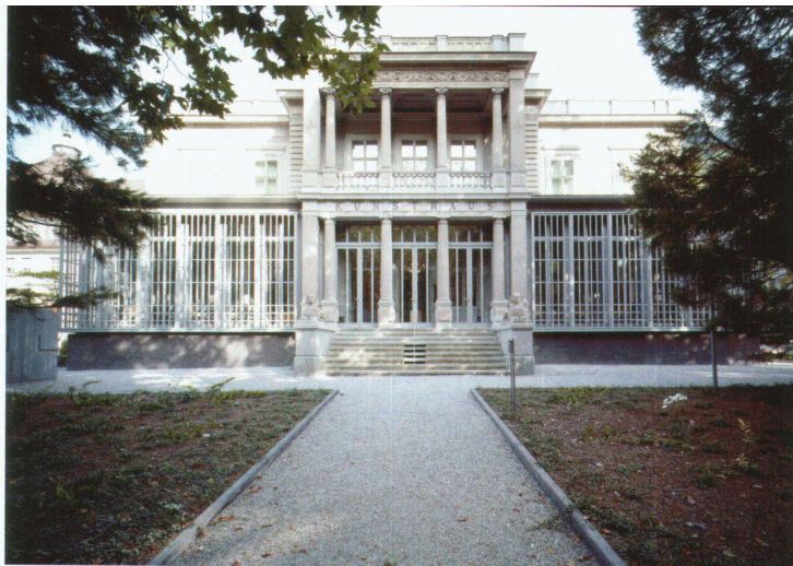
Bündner Kunstmuseum Chur in der von P. Zumthor umgebauten Villa.