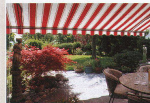
Hartmann bietet Lebensqualität Sonnens- und Wetterschutz