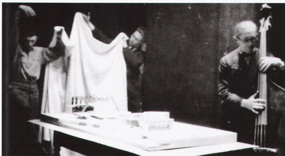
Le Corbusier beim Kontrabassspiel, als gerade das Modell des Sowjetpalastes enthüllt wird – Ingenieurform im Raum der Synästhesie, und auch eine Antwort auf den Galerietrakt des Hauses Raoul La Roche in Paris

Jean-Louis Cohens neue, französischsprachige Le Corbusier-Biografie gibt eine Fülle von Einsichten zu diesen komplexen Zusammenhängen. Sie wählt abwechselnd eine höchst private und eine weit ausholend ideengeschichtliche Optik, kreist Biografie und Werk anhand von Le Corbusiers Kommentaren über sich selbst ein, wie man sie etwa in den zahllosen Briefen an die Mutter findet, und dann wieder anhand von Passagen aus Nietzsches «Also sprach Zarathustra» oder aus der «Fröhlichen Wissenschaft», die Le Corbusier seinem Elefantengedächtnis einverleibt hatte. Vor allem aber wagt es Cohen seit Langem als Erster,