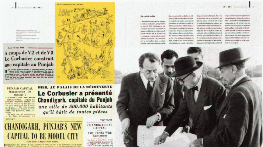
Buchumschlag und Innenseiten, Le Corbusier in Milano, 1951