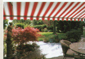
Hartmann bietet Lebensqualität Sonnens- und Wetterschutz