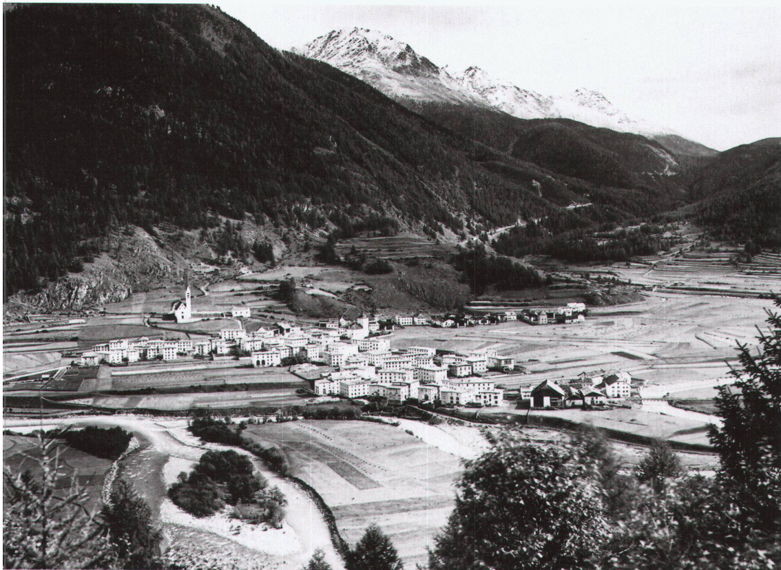
Zernez, Aufnahme von 1905. – Bild: Eidgenössisches Archiv für Denkmalpflege, Sammlung Photoglob