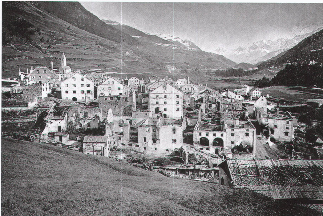
Links: «Lavin brennt», Ölbild von Guido Carmignani aus Parma (1838–1909), um 1870, Privatbesitz Lavin. – Bild: Nott Caviezel Unten: Brandstätte von Lavin mit Blick nach Osten. – Bild: A. Gabler, Interlaken; Schweiz. Landesbibliothek Bern