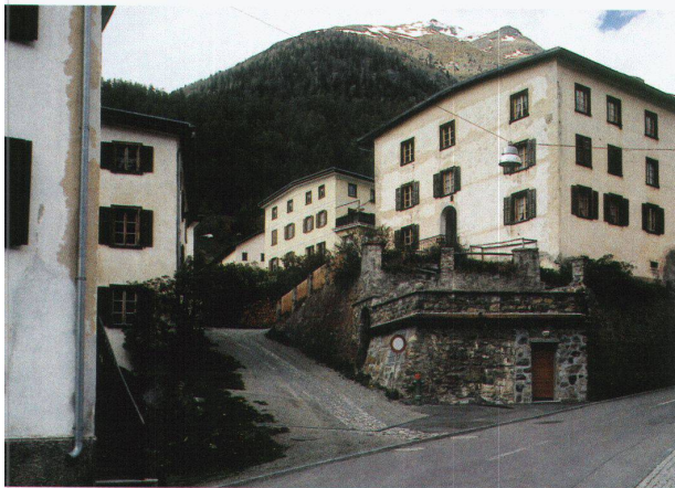
Ansichten aus Neu-Lavin; alle Häuser besitzen flach geneigte Holzzementdächer und gemauerte Ökonomietrakte.