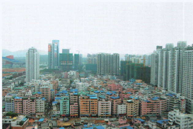
Gangsha Village, Shenzhen