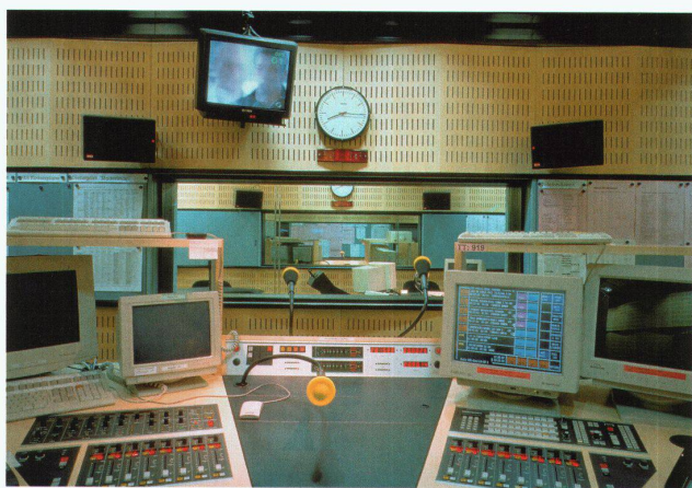
Regieraum von Radio DRS in Zürich von 1993

In einem Radiostudio muss man die Raumakustik von allen Seiten behandeln. In anderen Räumen befinden sich die Schall absorbierenden Elemente meist nur in der Decke, in einem Studio in Decke, Wänden und Boden. So galt es für Architekt und Akustiker, optische Transparenz und