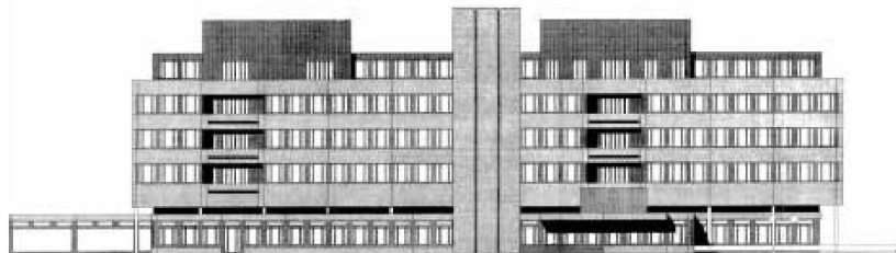
Nordostansicht, Hangseite. Bestand, Architekt Heinrich Buff. Darunter: Fassade