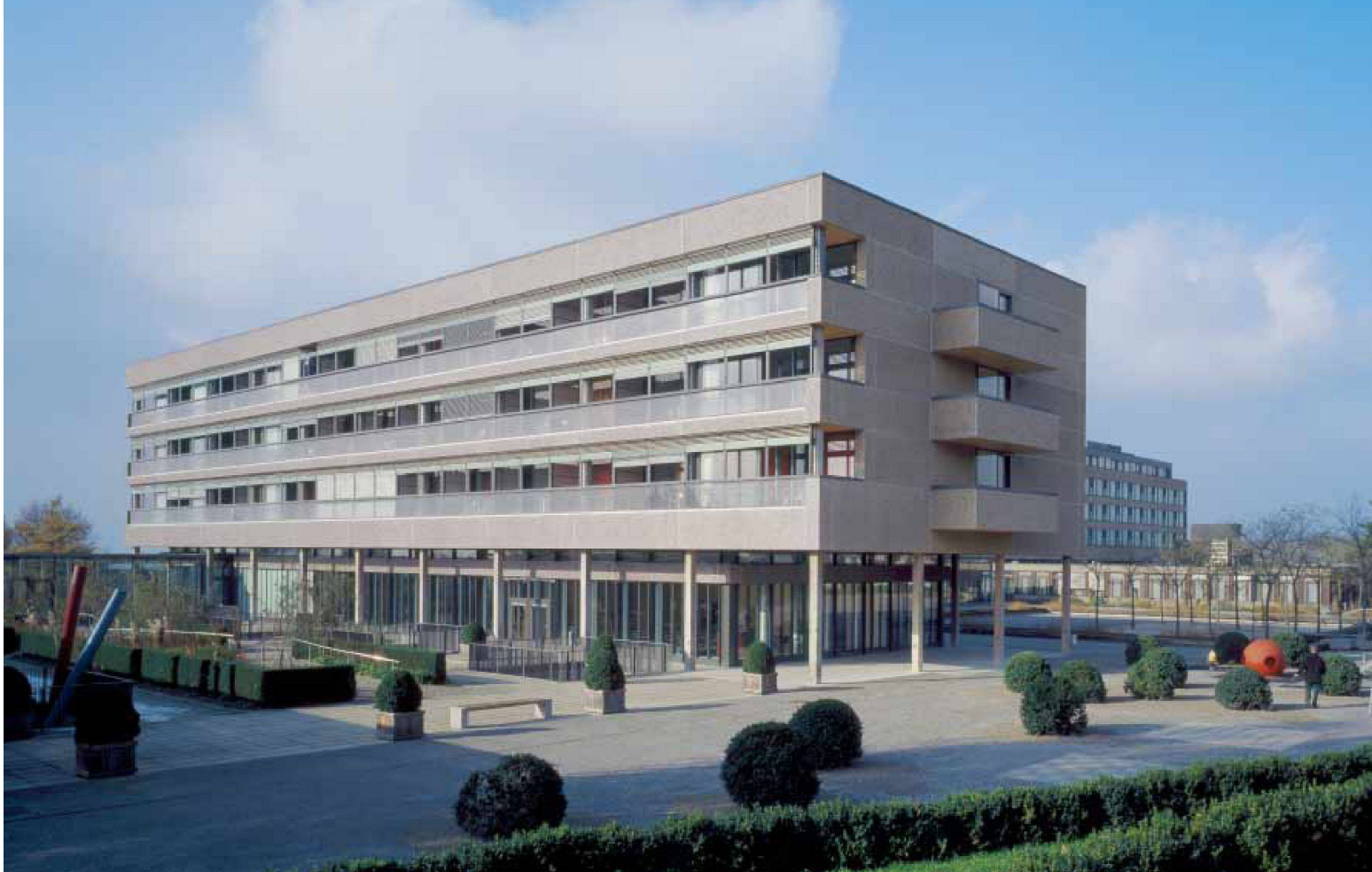
Talseite, Ansicht aus Süden. Unten: Gebäudeecke, Bestand und erneuert: Öffnung über Eck, Brüstung aus Glas mit Brüstungsbalken aus Beton.