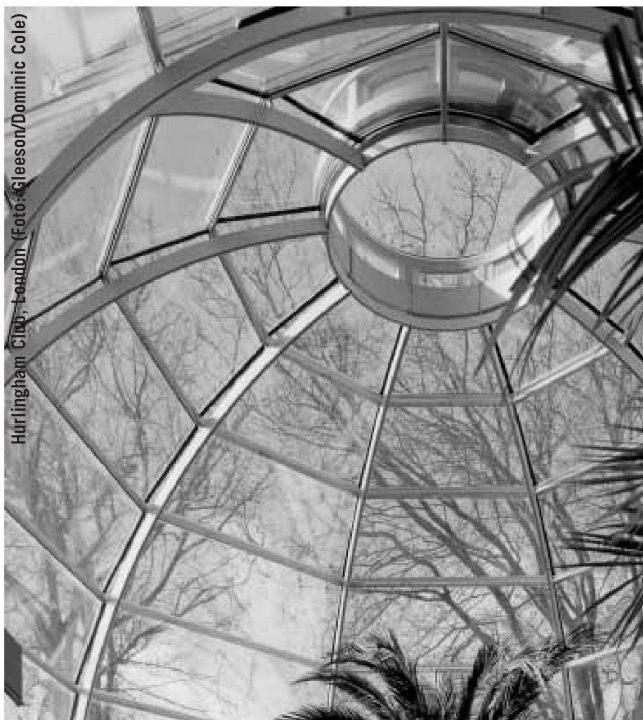
Hurlingham Club, London

Der 1921 geborene Genfer Architekt André Gaillard hat mit einer Reihe bemerkenswerter Bauten namentlich in den 1960er und 70er Jahren die Stadt Genf geprägt (vgl. den Beitrag über das CICG in diesem Heft). Die Broschüre publiziert ein aufschlussreiches Podiumsgespräch verschiedener Architekten, die sich aus heutiger Sicht über ihr Verhältnis zum Werk Gaillards äussern. Eine Auswahl von dreizehn mit Plänen und Fotos illustrierten Bauten des Büros Gaillard, vom Einfamilienhaus über den Wohnungsbau bis zu öffentlichen Bauten und Gebäuden für die Vereinten Nationen, bieten einen interessanten Einblick in Gaillards vielfältige und doch konsequente Arbeit. Eine erschöpfende Liste von Projekten und Realisierungen in Genf sowie eine nützliche Bibliographie beschliessen das Heft. Es ist das zweite einer Reihe kleiner Monographien, welche die Genfer Sektion des BSA über Genfer Architekten herausgibt. Die erste Nummer über François Maurice & Associés erschien 2003. Es bleibt zu wünschen, dass die Reihe in zügigerem Rhythmus weitergeführt wird und dass ihr eine ISBN-Nr. den Weg in den Buchhandel öffnet (Bestellungen: Mitglieder BSA an bassi@basicarella.ch , übrige an die Librairie Archigraphy, archigraphy@capp.ch ). nc