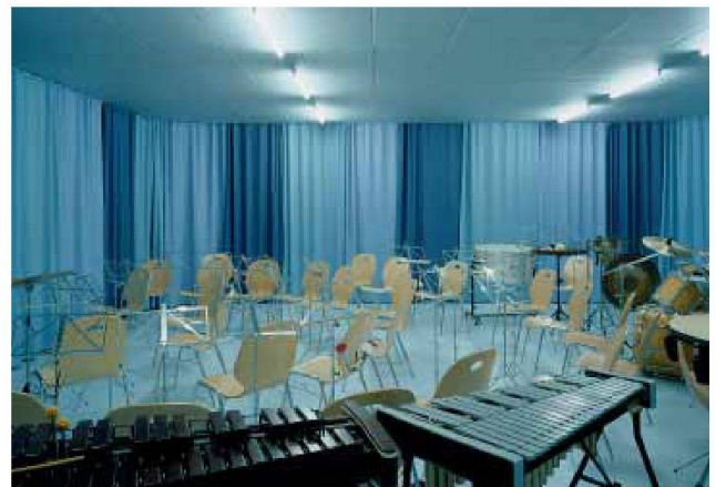
Vereinslokal im Untergeschoss