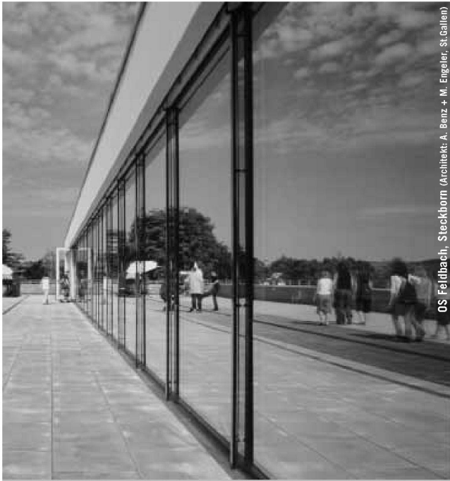
OS Feilbach, Steckborn (Architekt: A. Benz + M. Engeler, St. Gallen)

Partner für anspruchsvolle Projekte in Stahl und Glas