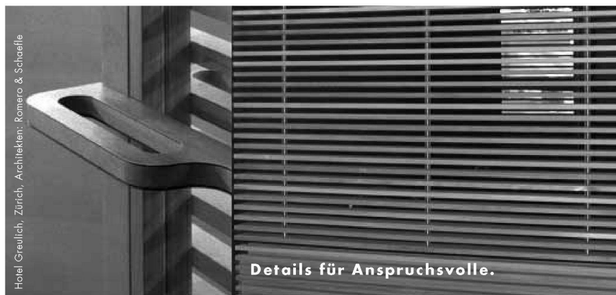
Hotel Greulich, Zürich, Architekten: Romero & Schaeffle