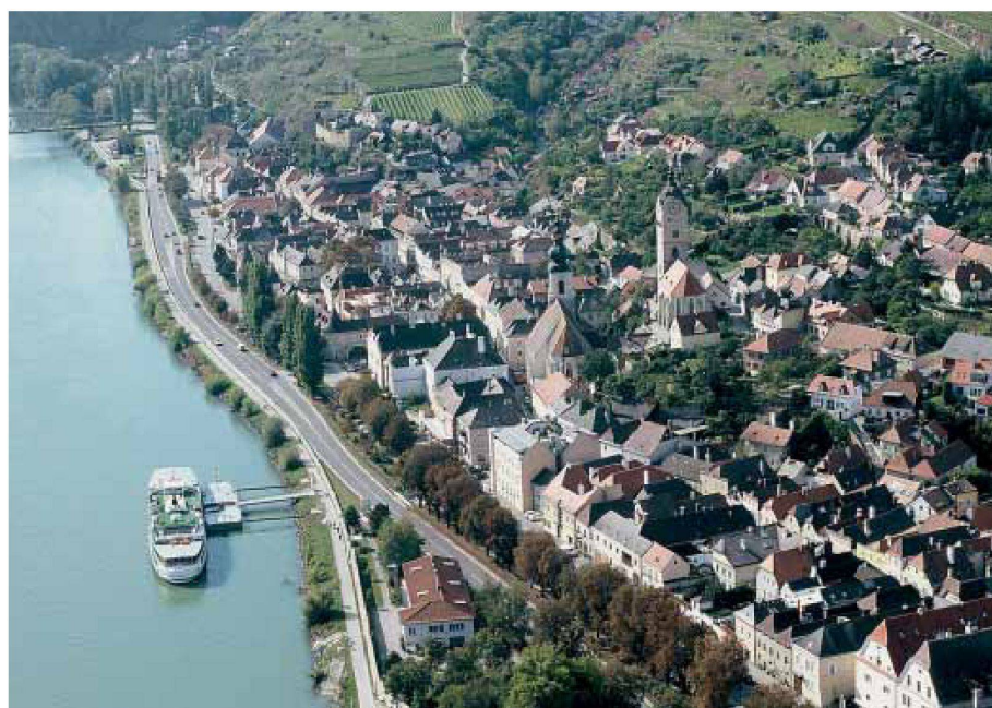
Krems-Stein heute, Schwarzplan und Luftaufnahme