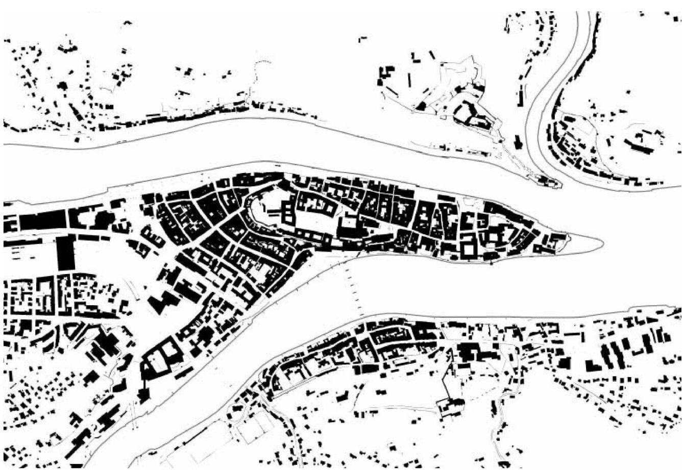
Passau, Schwarzplan und Relief