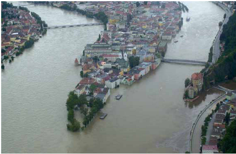
Passau, Hochwasser 2002. Von oben: Dreiflusseck, Donaulände, Innpromenade.