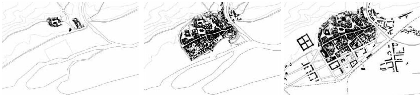
Kreams-Stein um 1020, 1520 und 1910

platzes, weshalb sie immer wieder überschwemmt wurde. Nach dem Katastrophenhochwasser von 1954 und einer Taufut von 1956 wurde eine Totalsanierung beschlossen, das Strassenniveau um etwa 4 m angehoben, eine Ufermauer errichtet, ein Grossteil der alten Gebäude abgebrochen und ersetzt, wobei die Wohn-geschosse über dem Pegel des 1000-jährlichen Hochwassers, 6,90 m über dem alten Strassenniveau zu liegen kamen. In den Erdgeschossen befinden sich vornehmlich Garagen. Das ursprüngliche Flair ging allerdings verloren, was heute bedauert wird.