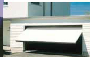
Hartmann öffnet Ihnen Tür und Tor: automatische Garagentore