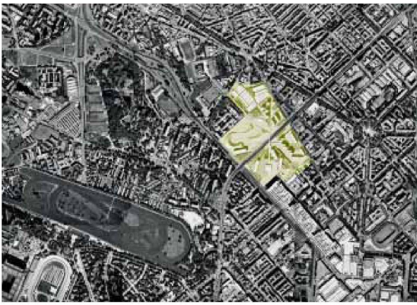
Situation, Modell und Grundriss der Wohnbauten von Cino Zucchi Unten: Kleine Kartonmodelle zum Fassadenstudium.