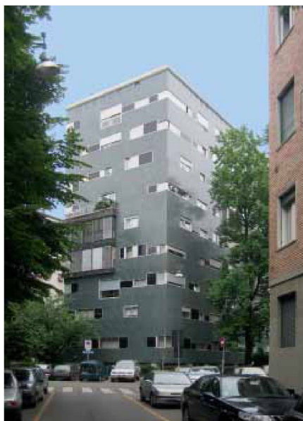
Links: Luigi Caccia Dominioni, Wohnhaus an der Via Nievo, Mailand 1955/56. – Bild: Elli Mosayebi

2 «Quando la nostra Architettura si riduce, forzatamente, alle facciate, non architettiamo, impaginiamo le finestre nella facciata: facciamo dei Mondrian coi cristalli: Asnago e Vender impaginano bellissime facciate, architettano una superficie, facendo dell'arte grafica.» Zitat aus: Gio Ponti, Amate l'architettura , Vitali e Ghianda, Genova 1957, S.140.