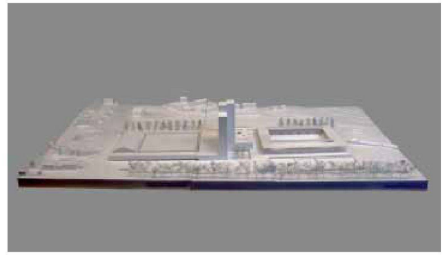
2. Rang (oben): Swisscanto Anlagestiftung, Zürich, mit Scheitlin, Syfrig + Partner, Luzern, Lussi + Halter, Luzern; Karl Steiner AG, Zürich; Karl Steiner AG Facility Management, Zürich