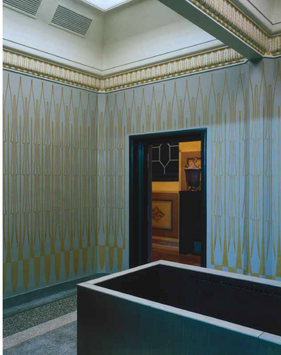
Aufbahrungsraum aus zwei ehemaligen Zellen