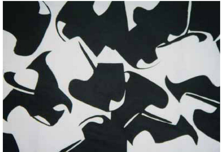
Unausgeführter Ornamententwurf von Stephanie Aebischer 2005, inspiriert von einem Gartensessel von Willy Guhl.

By now the cafeteria has been completely redesigned for a second time. The two projects implemented are very different in their approach and effect. The first examined the question of order and disorder, whereas the second dealt more with the classic decoration of individual building elements. ■