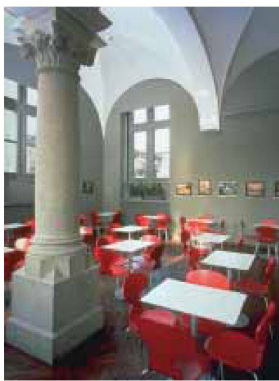
Die Cafeteria im Landesmuseum vor der Neugestaltung im Dezember 2005

Stefanie Wettstein Ein öffentlicher Raum an einem bedeutenden Ort wurde zum Laboratorium für ornamentale Raumgestaltung. Mit grossem Gewinn für den Raum und die beteiligten Studierenden.