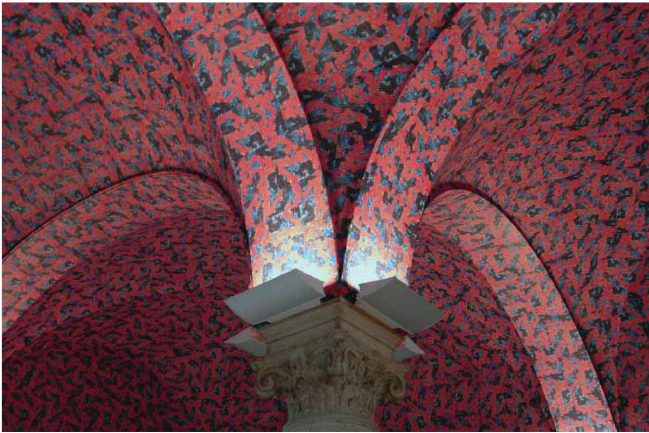
Detailansicht Gewölbe 2005, Nathalie Dähler.