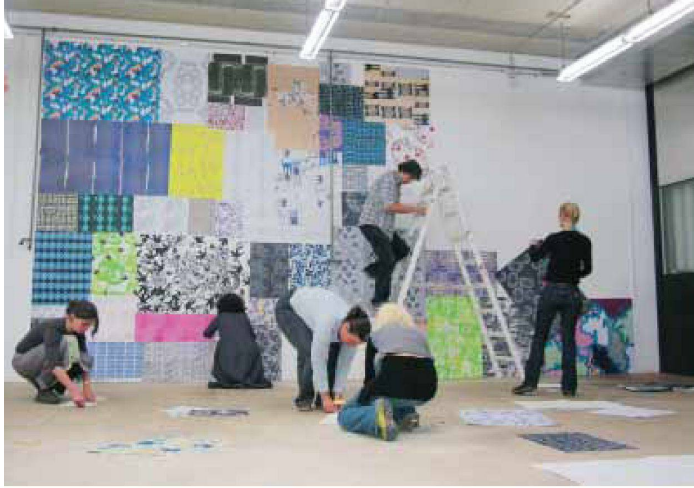
Ornamententwürfe von Studierenden der Höheren Fachschule für Farbgestaltung 2005

gewohnte Rapport, man suchte vergeblich den regelmässigen Rhythmus. Erst im Raumerlebnis als Ganzem wich die anfängliche Verwirrung der Sinne dem Eindruck von Ruhe und architektonischer Klarheit. Überraschenderweise wurde gerade dank dieser Ablenkung vom Einzelornament auf das Ganze die architektonische Struktur des Raumes mit ihren Gurten und Kreuzgewölben sichtbar wie kaum je zuvor. Dieses Raumerlebnis war so stark und einprägsam, weil es die anfängliche Konfusion in die Erfahrung von gestalterischem Reichtum und lebendiger Raumatmosphäre zu verwandeln vermochte.