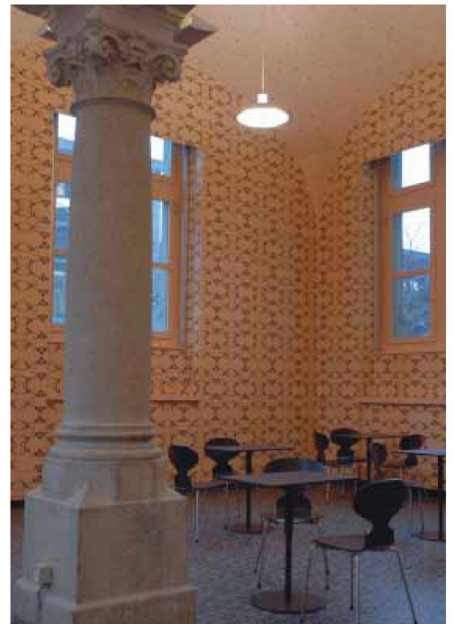
Gestaltung Dezember 2006, Béatrice Asper.