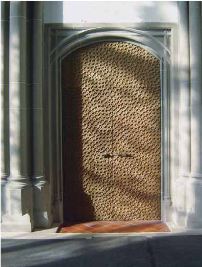
Neue Türe zur Ruhmeshalle im Obergeschoss.