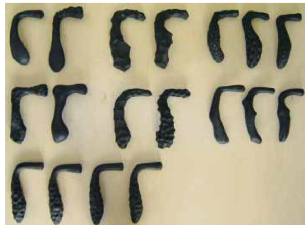
Türblatt aus Eichenholz, geätzt; Türgriff Bronzeguss patiniert und Variantenstudien.