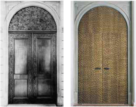
Neuer Abschluss der Mittelalterräume im Erdgeschoss und gleiche Türe aus der Erbauungszeit.