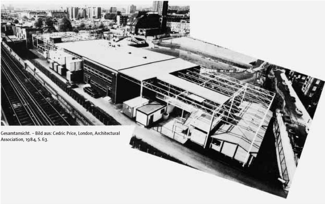
Gesamtansicht. – Bild aus: Cedric Price, London, Architectural Association, 1984, S. 63.

Die Bezeichnung der Räume folgt der Publikation in RIBA Journal November 1977 und entspricht nicht immer der tatsächlichen Nutzung. – Pläne aus: domus 581, April 1978