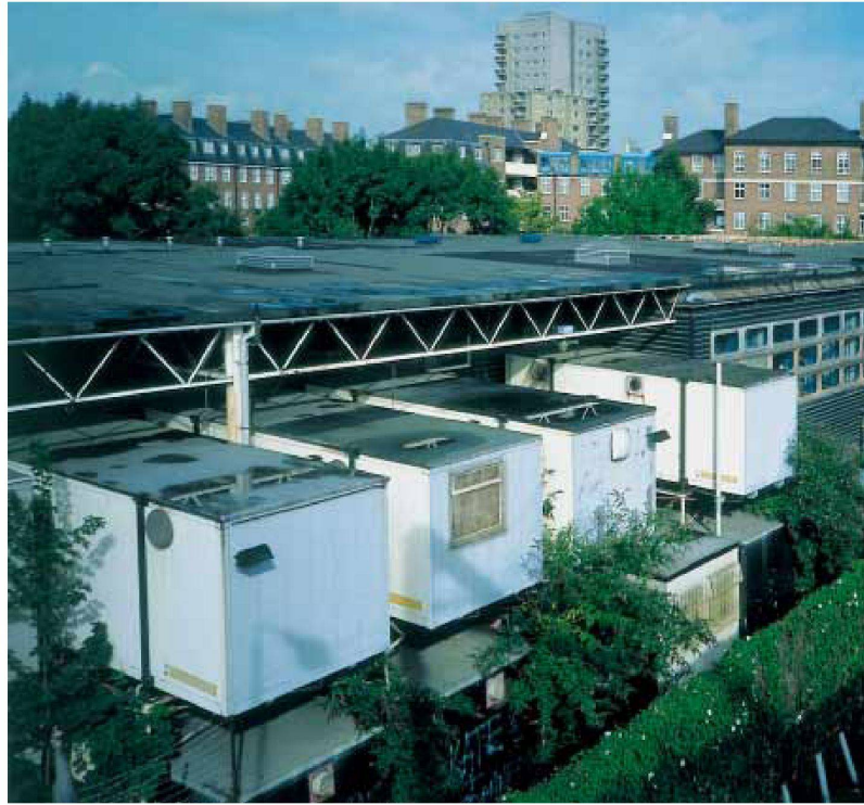
Inter-Action Centre, Zustand September 2000.