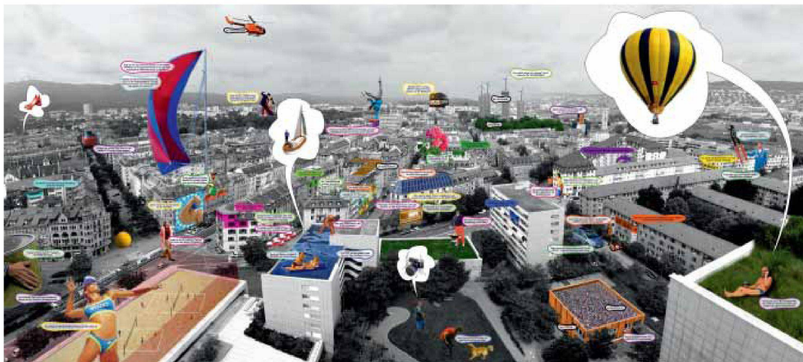
Mischa Badertscher Architekten, MY WORLD