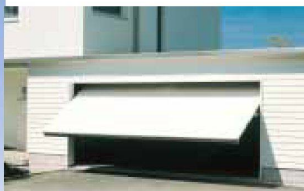
Hartmann öffnet Ihnen Tür und Tor: automatische Garagentore