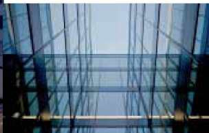
Hartmann setzt visionäre Architektur um: Fassadenbau