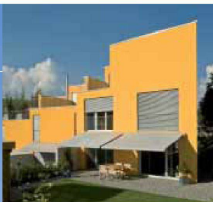
Hartmann bietet Lebensqualität: Sonnen- und Wetterschutz