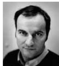
Francesco della Casa